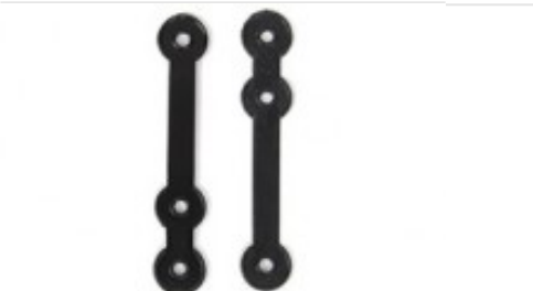
Composè 3 per completi Modello a Fettuccia