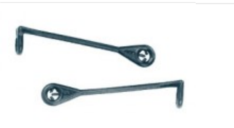
Composè 2 per completi Modello a Bastoncino