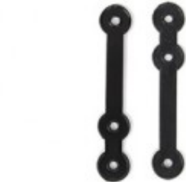
Composè 3 per completi Modello a Fettuccia