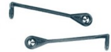
Composè 2 per completi Modello a Bastoncino