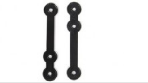
Composè 3 per completi Modello a Fettuccia