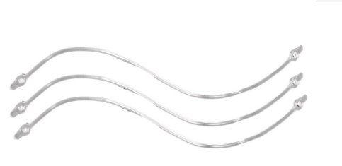
PVC Fils arrêts pantalons