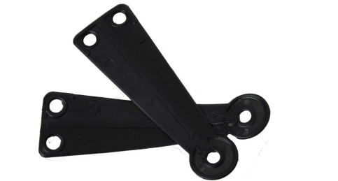
Composè 1 per completi Modello a Triangolo