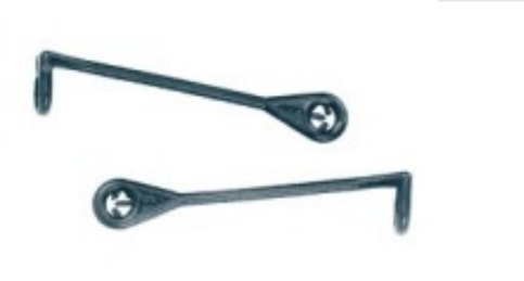
Composè 2 per completi Modello a Bastoncino